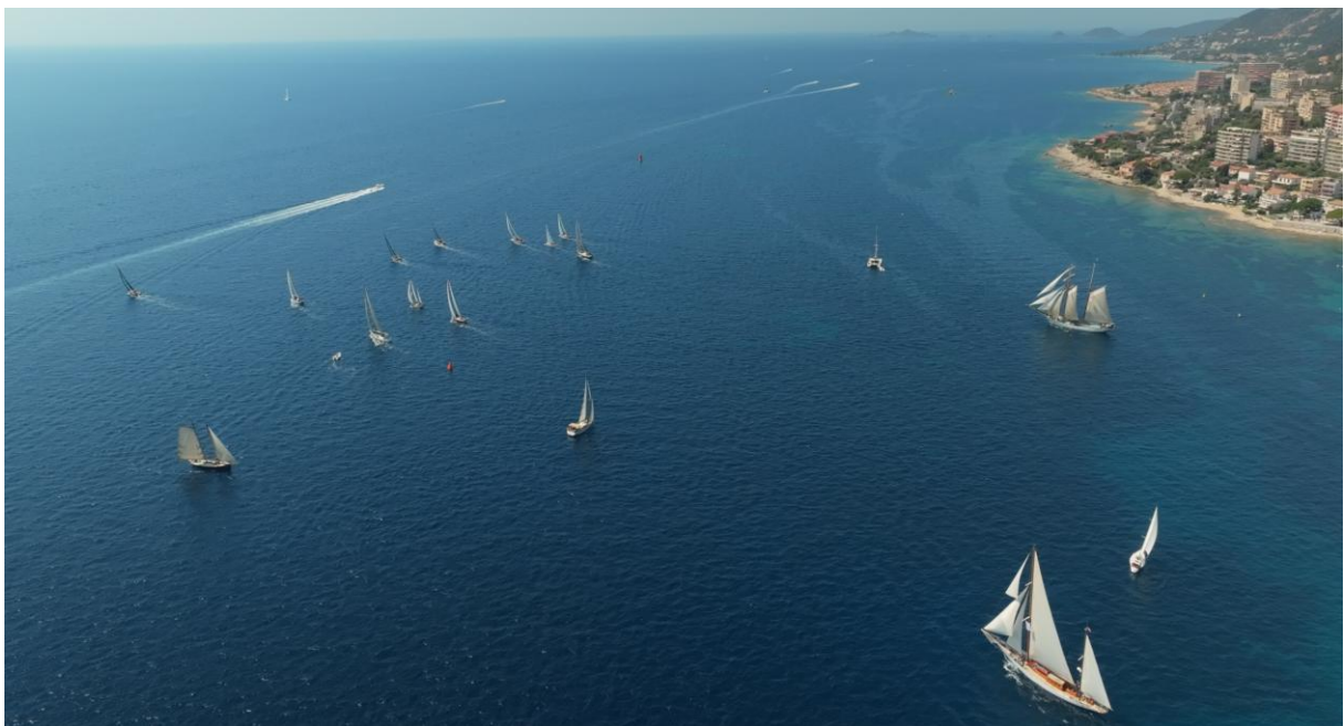
Corsica Classic 2023 Ajaccio – Propriano ligne de départ

Ville génoise fondée au XVe, capitale du corail jusqu'au XIXe, siècle au cours duquel Elle va découvrir sa véritable vocation de station balnéaire et touristique, elle est desservie par un plan d'eau idéal pour les sports nautiques. Depuis une vingtaine d'années, elle est devenue le passage obligé des beaux yachts de tradition du circuit méditerranéen.