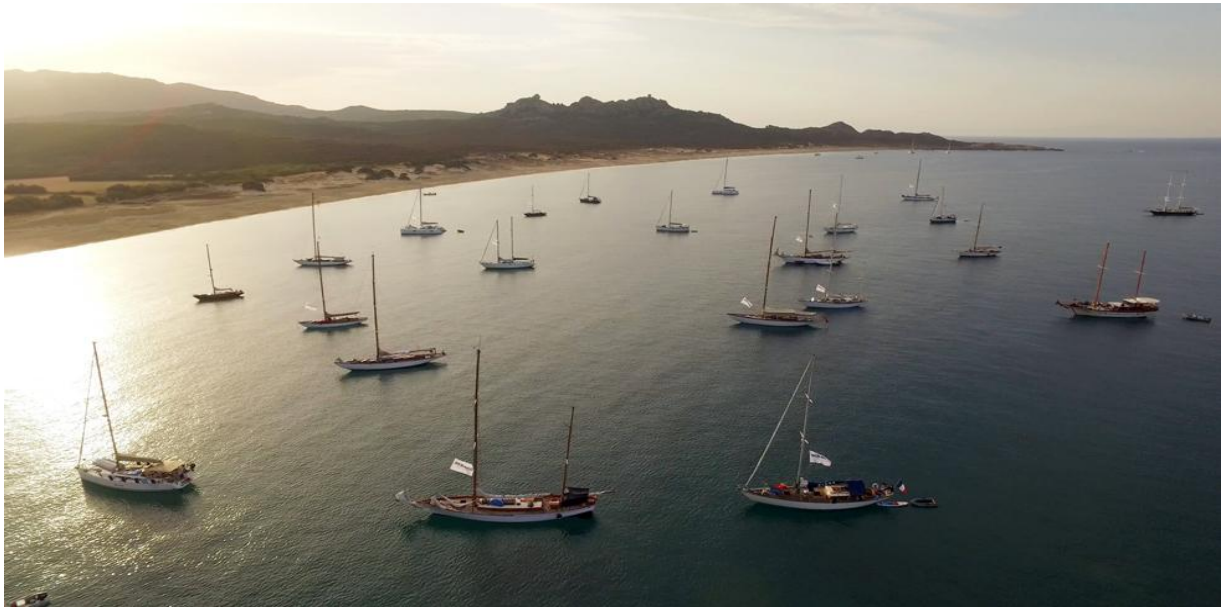
Corsica Classic 2017 Plage d'Erbaju Domaine de Murtoli

La Corsica Classic est ouverte à tous les yachts de tradition jaugés CIM 2026, les "Esprits de tradition" et modernes jaugés IRC 2026 et Osiris. Affiliée à la Fédération française de voile (FFV), la course s'inscrit dans le circuit officiel organisé par le Comité International de Méditerranée (CIM) et l'Association Française des Yachts de Tradition (AFYT).