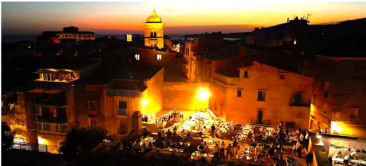
Corsica Classic 2022 Bonifacio Bastion de l'Etendard remise des prix 13ème édition