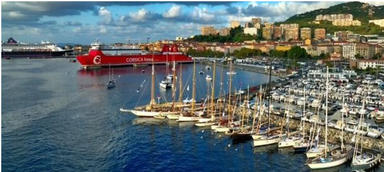
Corsica Classic 2025 Ajaccio Port Charles Ornano