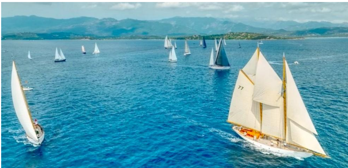
Corsica Classic 2025 Saint-Cyprien Bonifacio ligne de départ