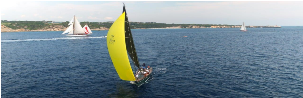
Bonifacio Corsica Classic 2023 SY Hounbonne IV Trophée de la ville de Bonifacio Antoine Zuria

19h : cocktail de bienvenue mairie de Lecci sur la plage CCY x Pietra x Cap Mattei