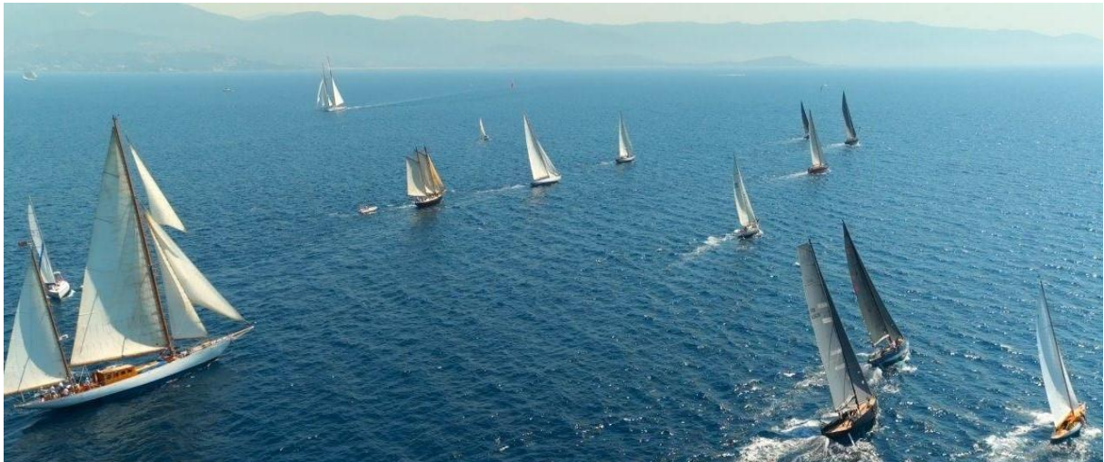
Corsica Classic 2023 Ajaccio – Propriano ligne de départ

Ajaccio est une ville riche d'une histoire de France particulièrement marquée par les Bonaparte et par l'épopée napoléonienne, dont les trésors s'exposent au musée Fesch. Mais Ajaccio c'est surtout sa rade qui se prolonge au large par les inoubliables Îles sanguinaires chantées par tant de poètes et d'écrivains.