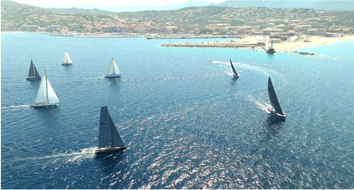
Corsica Classic 2023 ligne de départ Propriano – Campomoro