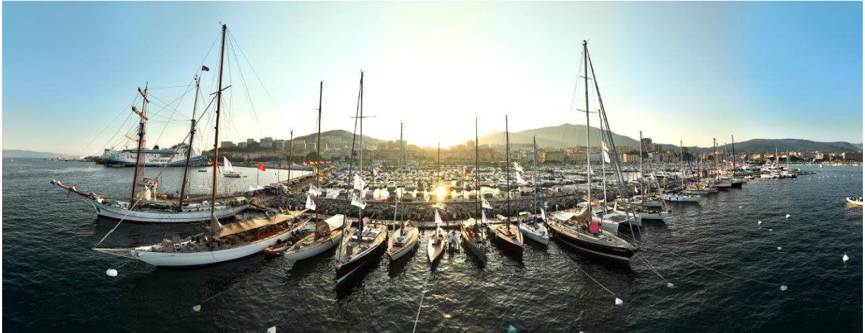
Corsica Classic 2023 Ajaccio Port Charles Ornano