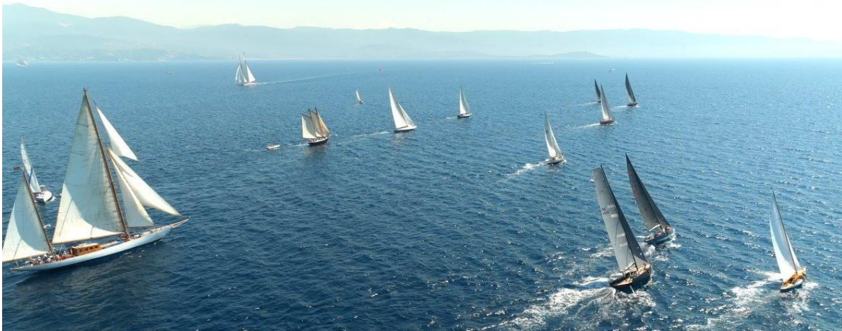
Corsica Classic 2023 Ajaccio – Propriano