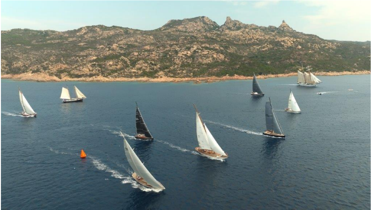
Corsica Classic 2023 Bonifacio ligne de départ Fazio