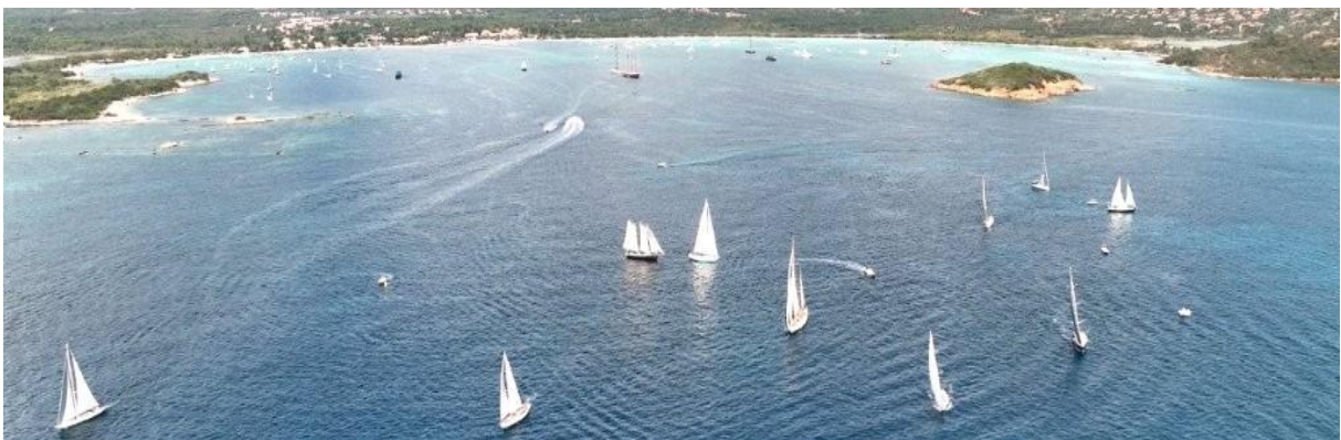
Corsica Classic 2022 Saint-Cyprien

4.2 Registration confirmations will be recorded sunday august 23 in Ajaccio port Charles Ornano, from 9 am to 5 pm