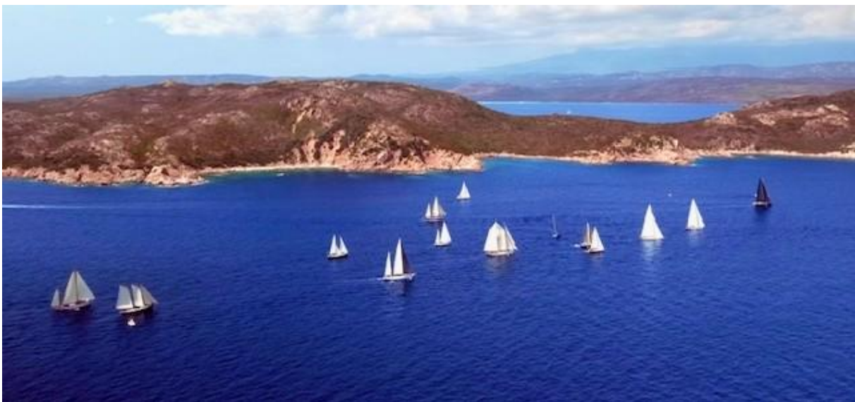
Corsica Classic 2025 Bonifacio – Saint-Cyprien ligne de départ Santa Manza

Bonifacio est la citadelle de l'extrême sud de la Corse, régnant sur un domaine maritime englobant les îles Lavezzi et Cerbicales et veillant sur ses fameuses « Bouches » qu'empruntèrent les Pisans, les Génois, les Aragonais, les turcs... tous ceux qui marquèrent son histoire toujours présente par ses monuments, trésors d'art et d'architecture, protégés par ses fortifications :