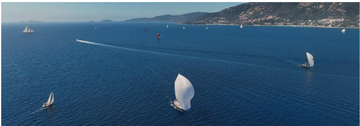
Corsica Classic 2023 Ajaccio Trophée de la Ville

My Travel Dreams, Ajaccio Magazine, Luxury Estate, Le Petit Bastiais, Dedicate Magazine, Men's Up, Sports Marketing, the luxe world, Le Figaro (Et Vous), Le Figaro Nautisme, Wad Mag, Bateau Vintage, Yachting Classique, Sail Couture, Auto Plus Mag, Sports Auto, Voile Magazine, Chasse-Marée, Bateaux, CIM, AFYT, Yacht Club de France, Yachting Classque, Vintage Classic Yacht Club, Tarpon Magazine (Russie), Skipper (SUI) Aria Magazine (Air Corsica), Air France Madame, Paris sur La Corse, L'Exception, The Australian, Le Point, Luxe Magazine, Live Style, Info travel, Lui Magazine, France Today, Yach.de, Air Zen, Explore France, Orange, https://www.corsica-classic.com/Revue-de-presse-Corsica-Classic-Yachting-2025_a365.html