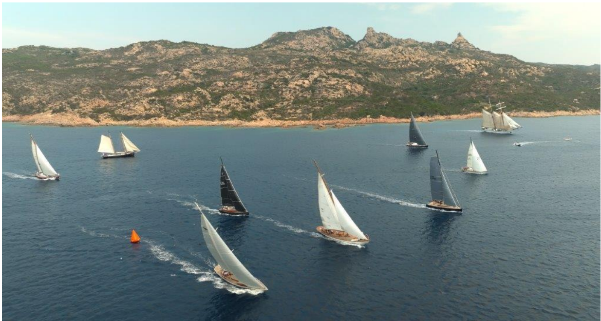
Corsica Classic 2023 Bonifacio ligne départ

19h : cocktail de bienvenue de la ville de Bonifacio x CCY x Pietra