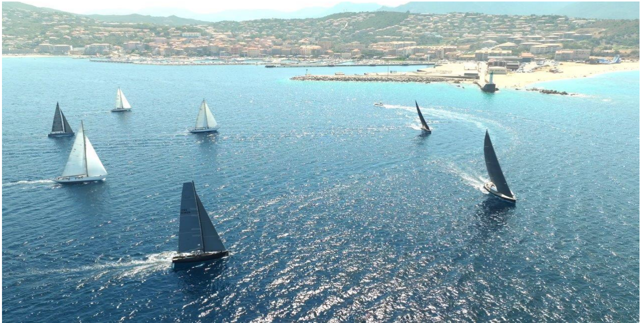
Corsica Classic 2022 ligne de départ Propriano – Campomoro

9h : petit-déjeuner Callysthé, Granola di Laura, La Corsica, Biscuiterie d'Afa 10h : briefing VHF 11h : départ mouillage 12h : départ régates Portigliolo - Propriano 19h : cocktail de bienvenue de la ville de Propriano