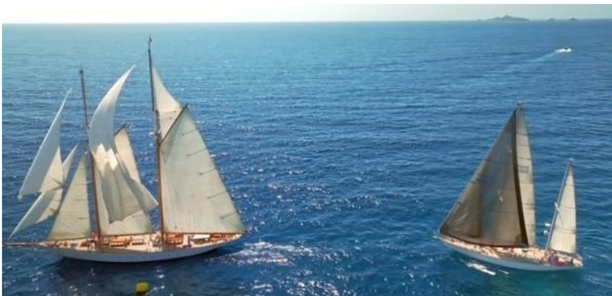
Corsica Classic 2025 marque du Scudo Ajaccio SY Puritan 1930 x SY Eve