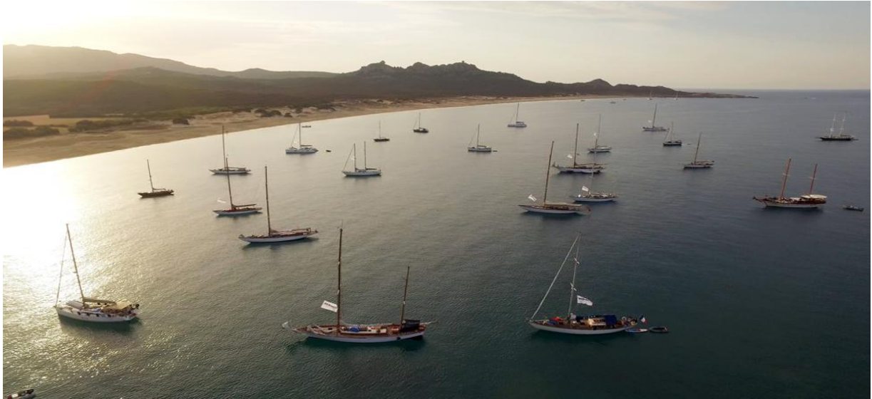
Corsica Classic 2017 Plage d'Erbaju Domaine de Murtoli

La Corsica Classic est ouverte à tous les yachts de tradition jaugés CIM 2026, les "Esprits de tradition" et modernes jaugés IRC 2026 et Osiris. Affiliée à la Fédération française de voile (FFV), la course s'inscrit dans le circuit officiel organisé par le Comité International de Méditerranée (CIM) et l'Association Française des Yachts de Tradition (AFYT).