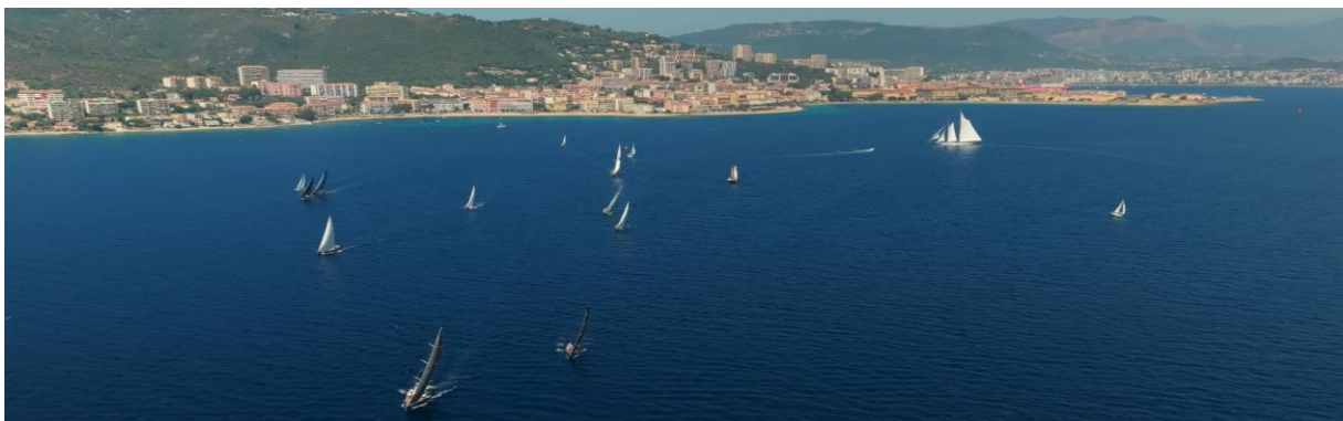
Corsica Classic 2023 Ajaccio - Propriano