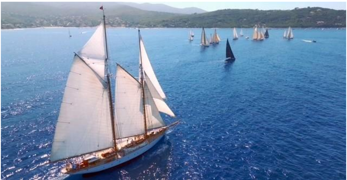
Corsica Classic 2025 ligne de départ Portigliolo – Propriano

La commune située à cheval sur les golfes d'Ajaccio et de Valinco comprend deux villages principaux : Coti situé en altitude - 500 mètres - et Acqua-Doria, niché dans une ambiance maritime, ainsi qu'une multitude de hameaux encore habités pour la plupart.