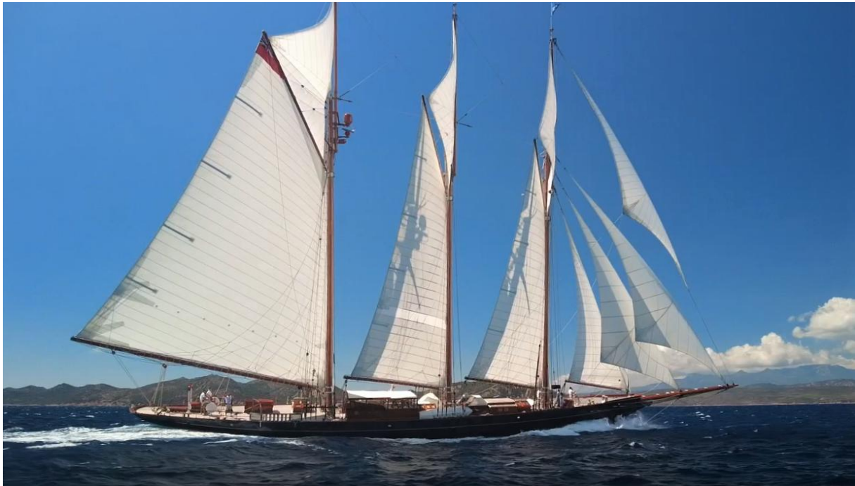
Corsica Classic 2022 Bonifacio – Saint-Cyprien SY Shenandoah of Sark