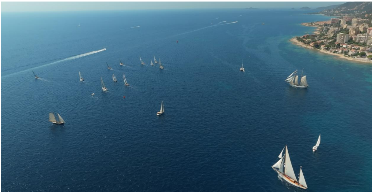
Corsica Classic 2023 Ajaccio – Propriano ligne de départ

Ville génoise fondée au XVe, capitale du corail jusqu'au XIXe, siècle au cours duquel Elle va découvrir sa véritable vocation de station balnéaire et touristique, elle est desservie par un plan d'eau idéal pour les sports nautiques. Depuis une vingtaine d'années, elle est devenue le passage obligé des beaux yachts de tradition du circuit méditerranéen.