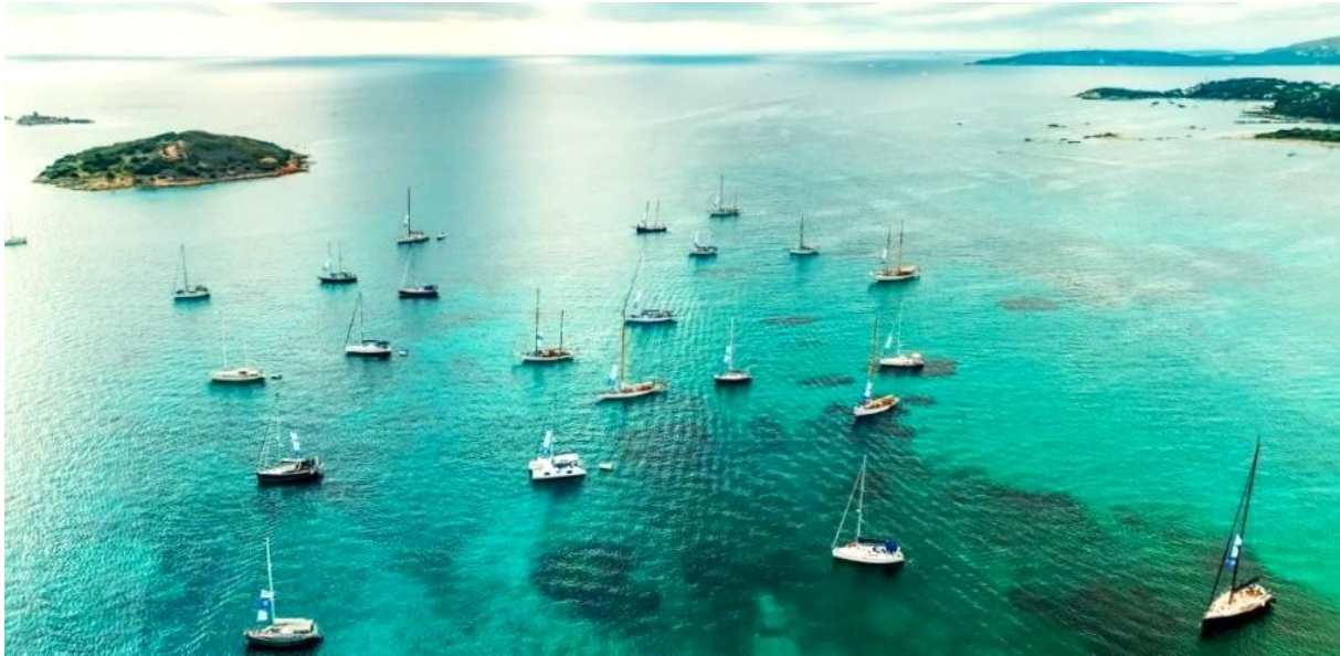
Corsica Classic 2025 Saint-Cyprien

Au nord de la plage, vers les eaux des étangs d'Arasu, sur les hauteurs, une tour génoise rappelle que sa voisine, Porto-Vecchio, est née au XVIe, lorsque la République de Gênes décida d'installer dans le golfe une nouvelle place forte.