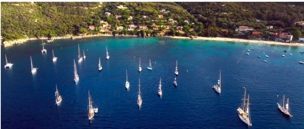
Corsica Classic 2025 Campomoro mouillage

Son histoire maritime nous ramène aux temps préhistoriques, il y a plus de trois millénaires avant notre ère. A Capu di Locu, un plateau en balcon sur la marine de Campomoro, les réalisations mégalithiques de ses occupants continuent de défier le temps. Abri Naturel, au décor et ambiance unique, elle est une étape incontournable dans le golfe du Valinco.