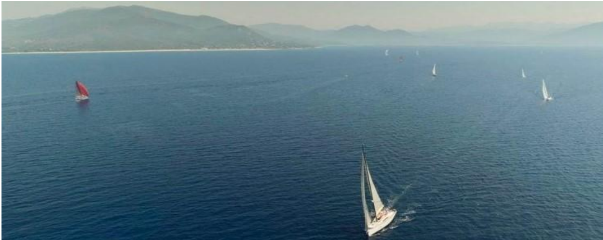
Corsica Classic 2023 Propriano – Campomoro

Naturellement abrité par le rocher de Scogliu Longu , Propriano était au début du XVI e siècle, une escale de la Piève de Fozzano qui accueillait les navires bonifaciens ou ajacciens venus charger le blé, l'orge et l'huile de la plaine di A Varia . En 1564, c'est à Propriano que le célèbre Sampiero Corso débarqua afin d'enlever la Corse à l'occupant Génois.