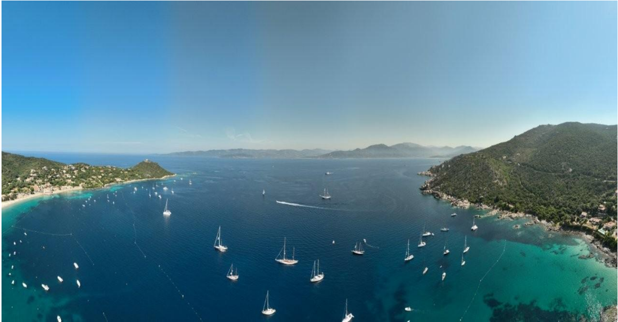
Corsica Classic 2023 Campomoro mouillage

A la pointe Sud du golfe du Valinco, la baie de Campomoro se dévoile tel un joyau grâce à sa belle plage de sable blanc et son eau turquoise. Son petit port de pêche a gardé toute son authenticité.