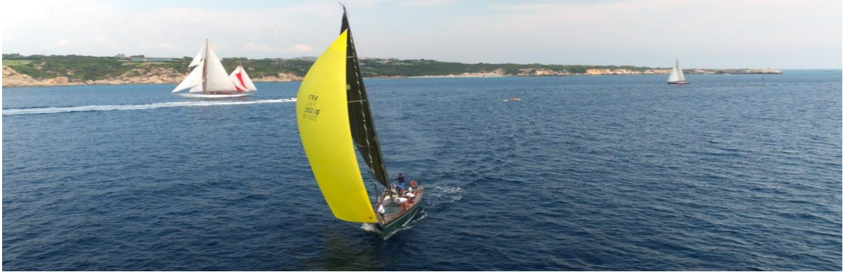
Bonifacio Corsica Classic 2023 SY Hounbonne IV Trophée de la ville de Bonifacio Antoine Zuria

10h : briefing sur le quai Bonifacio Marina 11h : départ du port de Bonifacio 12h : départ Bonifacio – zone de Mouillage, Saint-Cyprien 19h : cocktail sur la plage mairie de Lecci CCY x Pietra x Cap Mattei