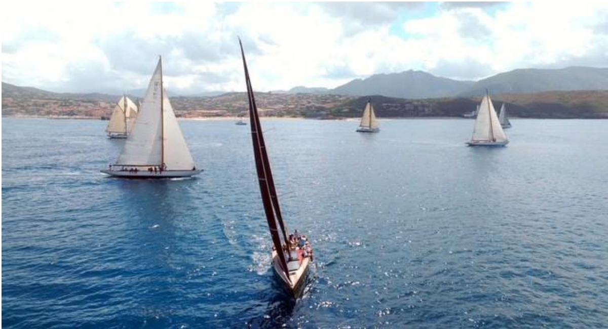
Corsica Classic 2025 Propriano

Entre 1838 et 1845, la construction d'une jetée sur les rochers de Scogliu Longu et de l'axe routier d'Ajaccio vers le sud de l'île permettra l'essor de la ville. Le port comprenant deux jetées, Propriano devint un point de liaison pour les bateaux à vapeur. Grâce au développement touristique des années 50, la cité du Valinco , avec ses plages, ses criques, ses loisirs, devient une station balnéaire de renom.