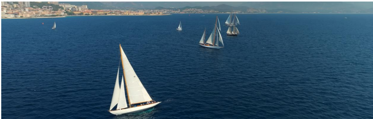
Corsica Classic 2023 Ajaccio Trophée de la Ville SY Ellen

Io Donna (Italie), Harper's Bazaar, Elle, Vanityfair, How To Spend It- Financial Times, Paris Match, Voici, Closer, GQ, TF1 (JT de 13H), France 2 (Télématin, Jt 13h), France 3 Via Stella (Corse), France 5 (Echappées Belles), M6 (Sport 6 et JT 19H45), Les Echos-Série Limitée, Air France Magazine, L'Officiel Yachting, Hôtel & Lodge, Rose Magazine, Mariefrance.fr, Voiles & Voiliers, Corse Matin, Corse Net Infos, In Corsica, Ici RCFM, Challenges, Up Style Travel, Wooden Boat, Classic Boat, Classicdriver, D8 (Direct Auto), RTBF (Belgique), TV Paese (Corse), Le Point, L'Humanité Dimanche, Yachting Classique, Lux World Wide, Alta Frequenza, Agence de Tourisme de la Corse, Jet Ex, Sailing Classic Boat (UK), Sviluppo Nautico (IT), Spiegel (NL), Media Sailors (US), Marine & Oceans