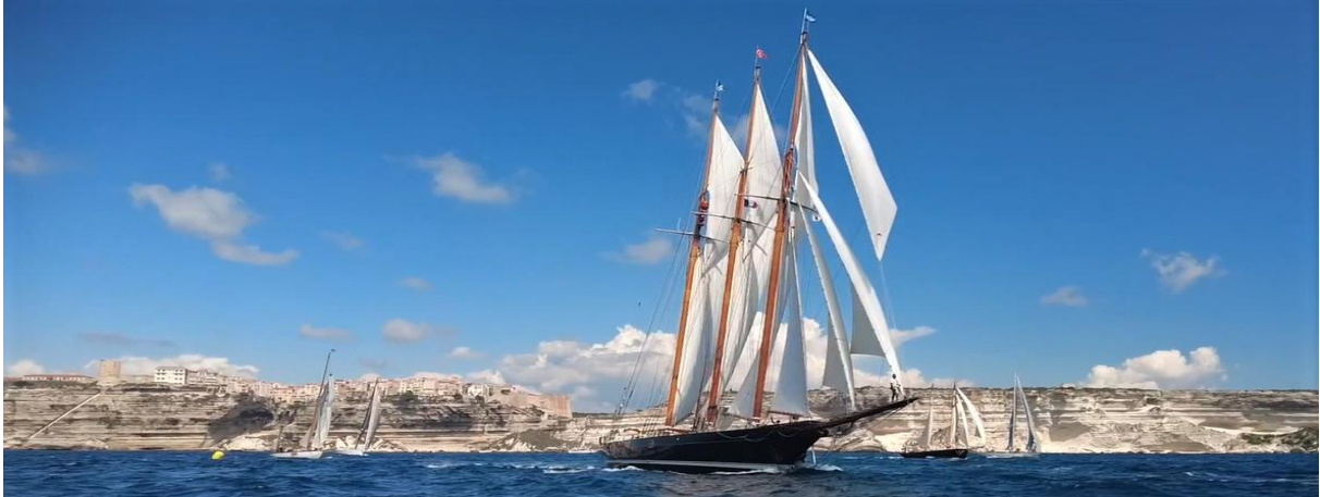
Corsica Classic 2022 Bonifacio – Saint Cyrien SY Shenandoah of Sark

La Corsica Classic 2026 sera le dix-septième Grand Cru de cette course côtière en étapes, organisée par l'association Corsica Classic Yachting, sous le patronage du Yacht Club de France. En une décennie, elle est devenue un événement sportif et life style incontournable en Méditerranée.