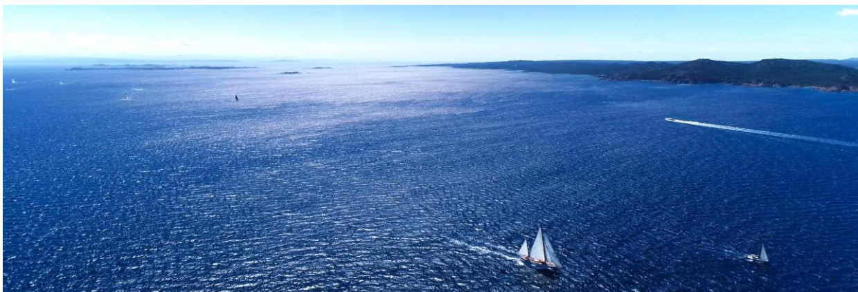
Corsica Classic 2022 Bonifacio - Saint Cyprien SY Belle Aventure x SY Mister Fips

20h – 23h : dîner de la remise des prix trophée de la ville confectionné par nos chefs en partenariat avec nos partenaires CCY au Bastion de l'Etendard.