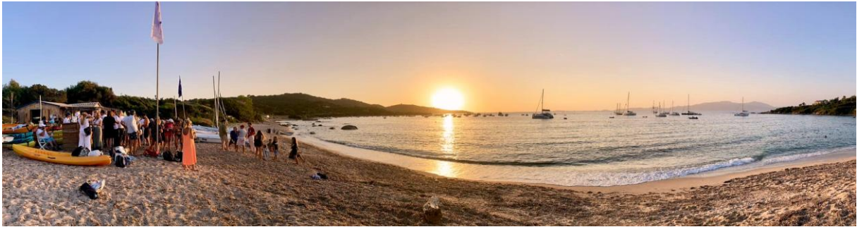
Corsica Classic 2024 - plage de Portigliolo, dîner de bienvenue

Coti-Chiavari, fondé en 934, est né de la transhumance, une ancienne tradition pastorale : à l'automne, les troupeaux étaient menés paître près de la plage, sur les terres de basse altitude, au climat plus doux, avant de retrouver les sites de montagne, Frasseto, Zévaco, Campo, au printemps. Leurs cortèges pittoresques s'étiraient encore le long des sentiers après-guerre.