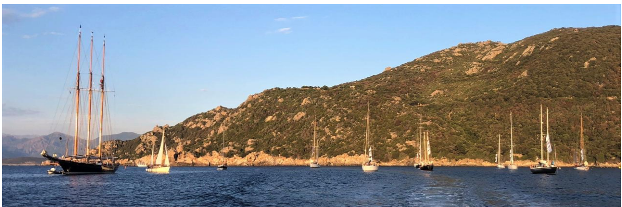
Corsica Classic 2022 Campomoro

9h : petit-déjeuner Callysthé, Granola di Laura, La Corsica, Biscuiterie d'Afa 10h : briefing sur le quai port de Propriano 11h : départ du port de Propriano 12h : départ régates Propriano - Campomoro 19h : cocktail de bienvenue du village de Campomoro sur la plage 23h : soirée CCY x Bar des Amis Campomoro quai des pêcheurs