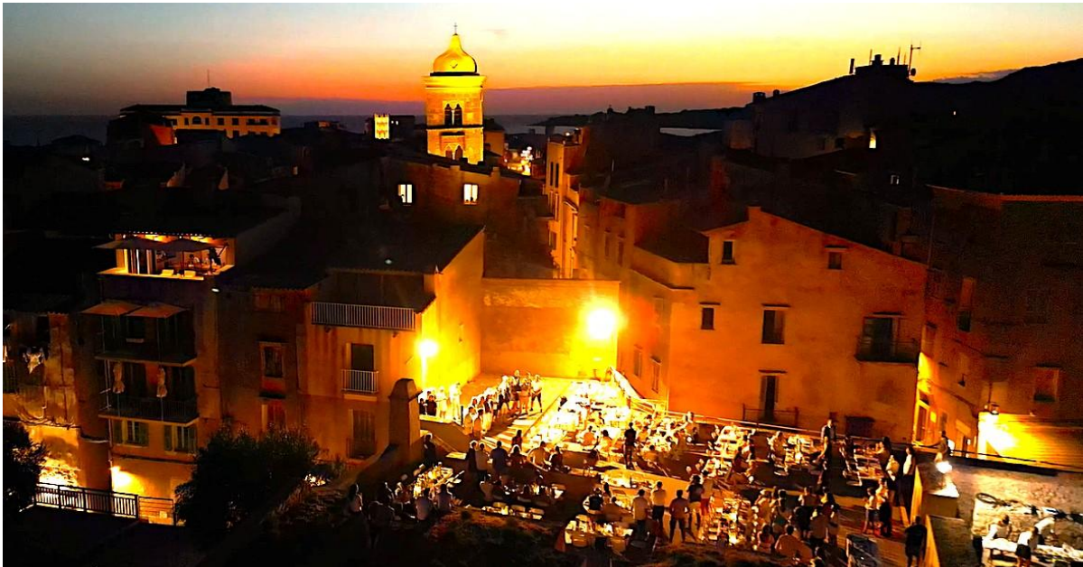
Corsica Classic 2022 Bonifacio Bastion de l'Etendard remise des prix 13ème édition