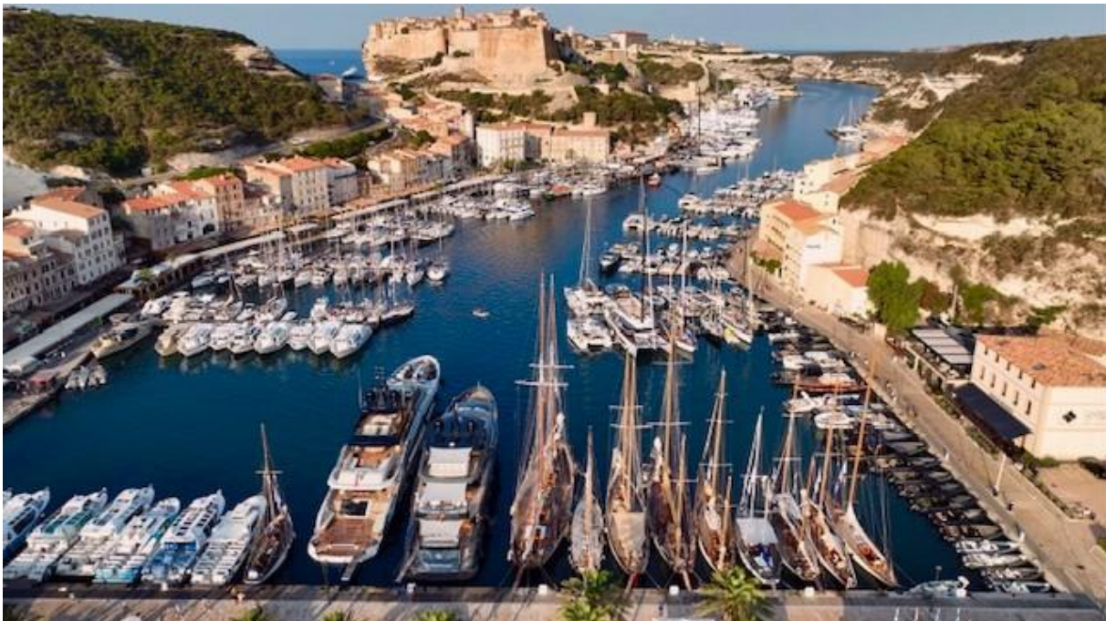
Corsica Classic 2025 Bonifacio

Les participants de la Corsica Classic prendront le départ d'Ajaccio Port Charles Ornano, où la flotte sera accueillie pour les inscriptions le dimanche 23 août, c'est un parcours sous les auspices de la Corse du sud pour cette dix-septième édition, au départ d'Ajaccio Port Charles Ornano, en passant par Portigiolo, Propriano, Campomoro et Saint-Cyprien pour un final à Bonifacio.