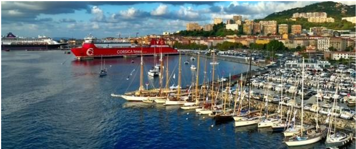
Corsica Classic 2025 Ajaccio Port Charles Ornano