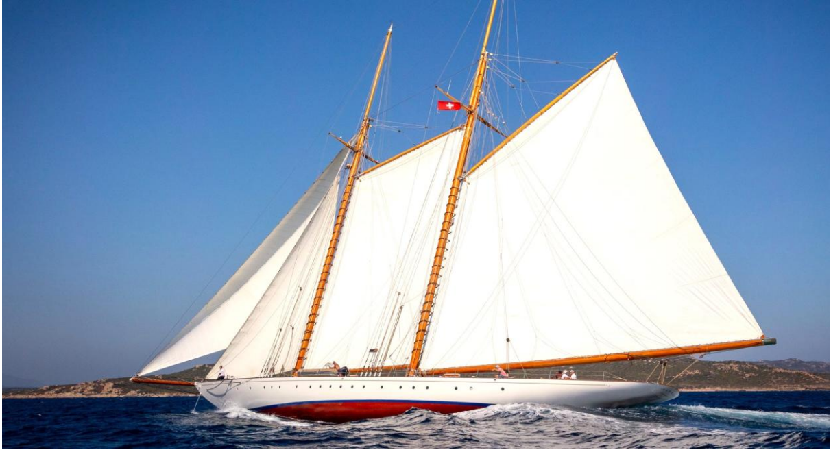
Corsica Classic 2023 Bonifacio SY Elena of London

Mondialement connue pour ses falaises de craie au sommet desquelles se niche sa ville haute, Bonifacio domine un fjord impressionnant et un port naturel accueillant entièrement réhabilité.