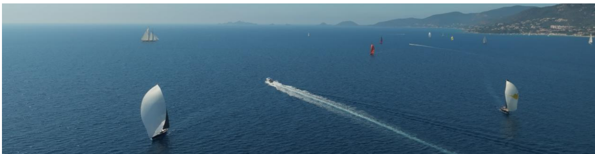
Corsica Classic 2023 Trophée de la Ville d'Ajaccio

L'ouverture vers le grand public est un axe de développement, avec la possibilité de participer aux courses et d'affrètements de yachts en invités. La Corsica Classic incarne à travers cet événement unique, des valeurs positives qui sont au cœur des enjeux de nos partenaires, entre performances individuelles et cohésion d'équipe, entre tradition et anticipation, entre maîtrise technologique respect de l'environnement et du patrimoine.