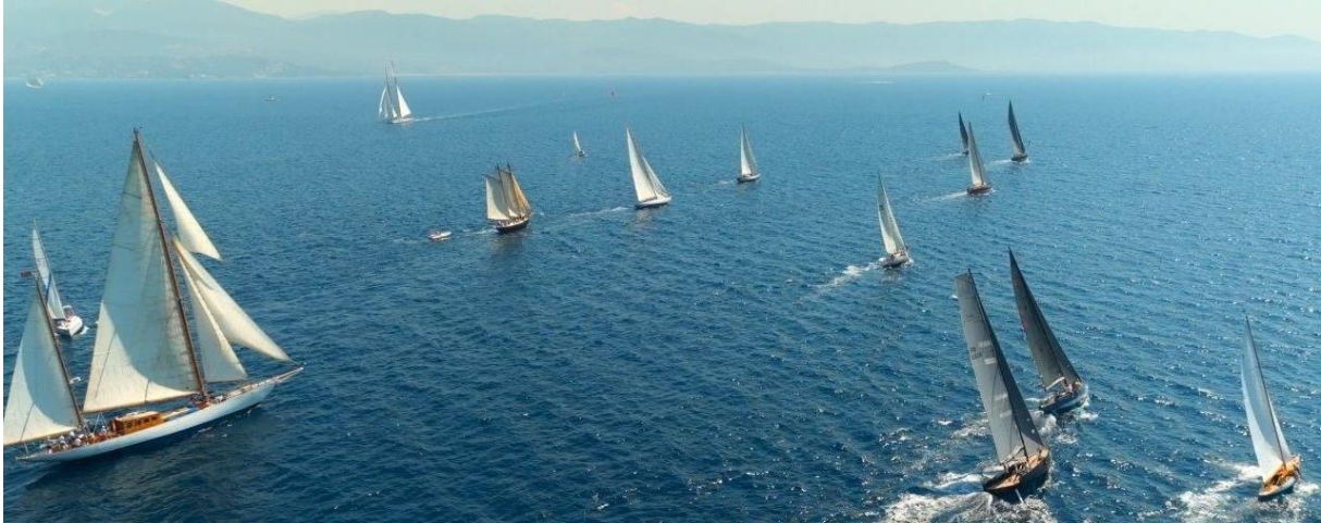
Corsica Classic 2023 Ajaccio – Propriano ligne de départ

Ajaccio est une ville riche d'une histoire de France particulièrement marquée par les Bonaparte et par l'épopée napoléonienne, dont les trésors s'exposent au musée Fesch. Mais Ajaccio c'est surtout sa rade qui se prolonge au large par les inoubliables Îles sanguinaires chantées par tant de poètes et d'écrivains.