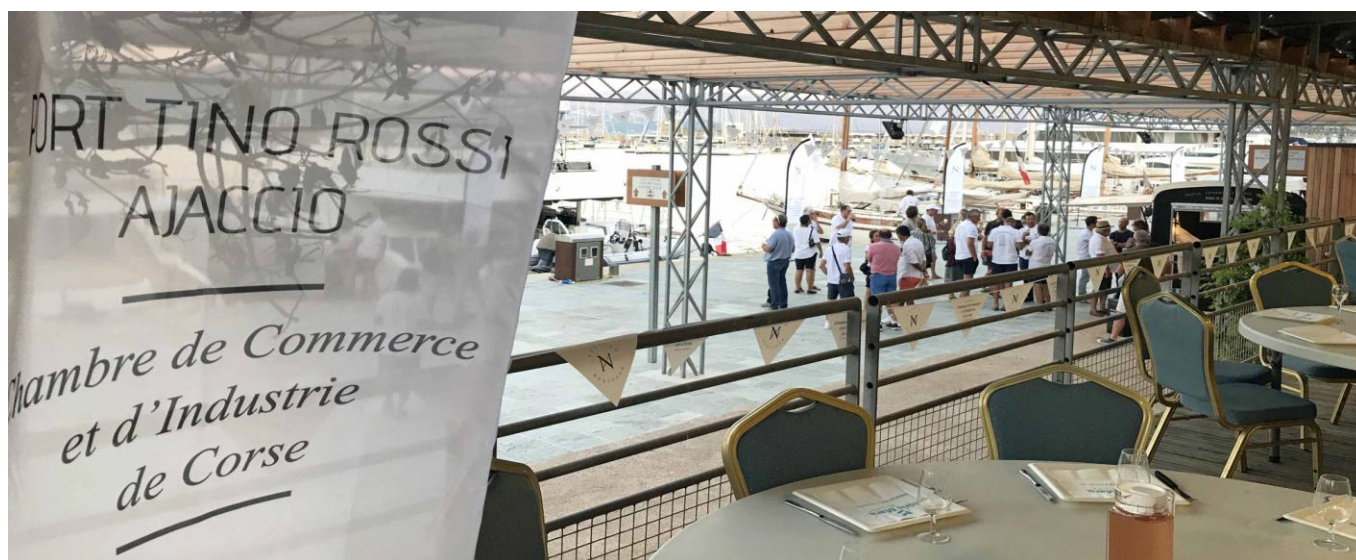
Régates Napoléon 2020 Port Tino Rossi Palais des Congrès Ajaccio

Président : Thibaud Assante +33 0684955784 contact@corsica-classic.com