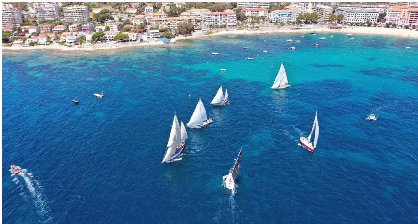
Régates Napoléon 2020 ligne de départ plage de Trottel

The regattas will be governed by the sailing racing rules, the notice of race, the sailing instructions, the class rules if applicable and the appendices. In case of translation of NOR, the French text will prevail. National prescriptions translated into English for non-French speaking foreign competitors [in appendix prescriptions]