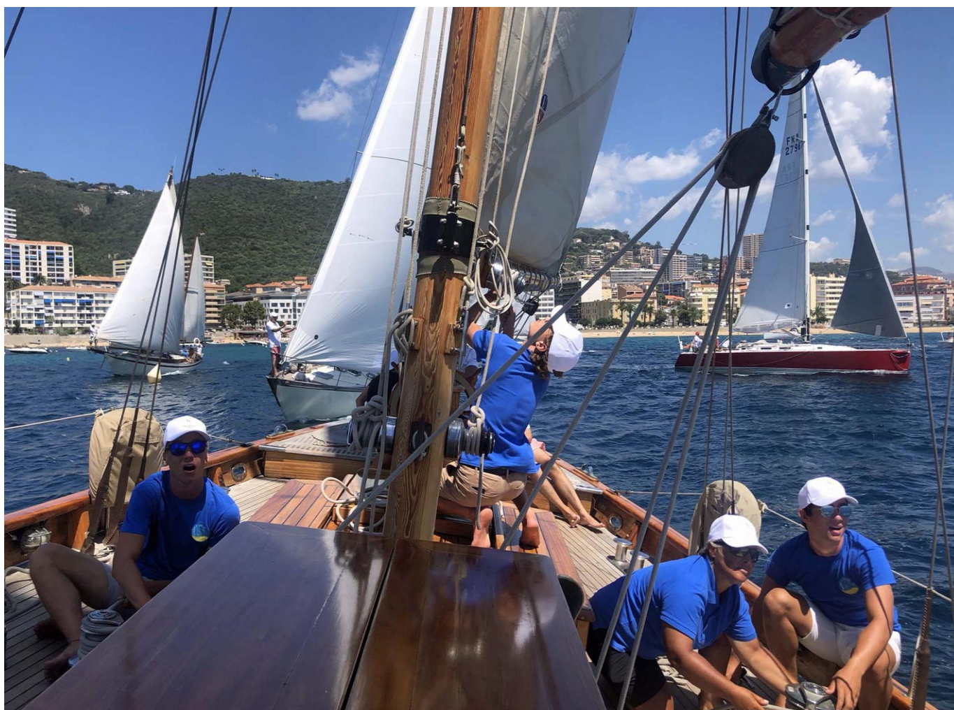
Régates Napoléon 2020 SY Hygie x Squadra Mare e Vela ligne de départ